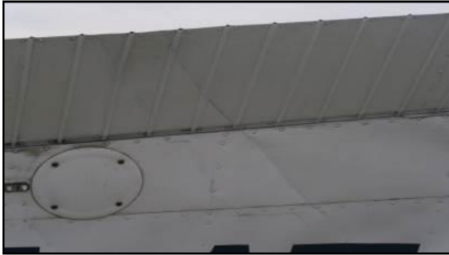
Fig. 4. Borde de fuga del ala izquierda e intradós del LV-CQJ.

Se observaron marcas dejadas por el LV-CQJ sobre el empenaje y la parte superior trasera del fuselaje del LV-BSH, como así también daños sobre el alerón y plano derecho.