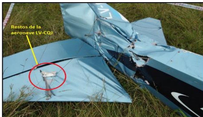
Fig. 7. Golpe en el estabilizador fijo horizontal y en el estabilizador fijo vertical del LV-BSH.

La investigación estableció que los restos encontrados sobre el empenaje del LV-BSH corresponden al borde de ataque del ala izquierda del LV-CQJ, cerca de la punta de ala, y se encontraron en el estabilizador horizontal del LV-BSH.