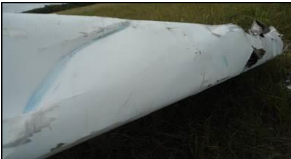
Fig. 3. Borde de ataque del ala izquierda del LV-CQJ.

En el borde de ataque del ala izquierda y en el intradós del LV-CQJ se encontró transferencia de pintura del empenaje del LV-BSH.(ver figuras 3 y 4).