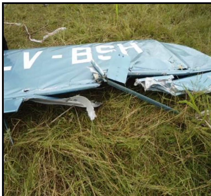
Fig. 5. Golpe en el borde fuga y alerón derecho del LV-BSH.

Se trató de reproducir la geometría de la colisión acercando los restos de las aeronaves. Para ello, se trasladaron los restos de la aeronave LV-BSH al lugar donde el LV-CQJ impactó con el suelo. La geometría de la colisión está desarrollada en la sección Análisis del informe.