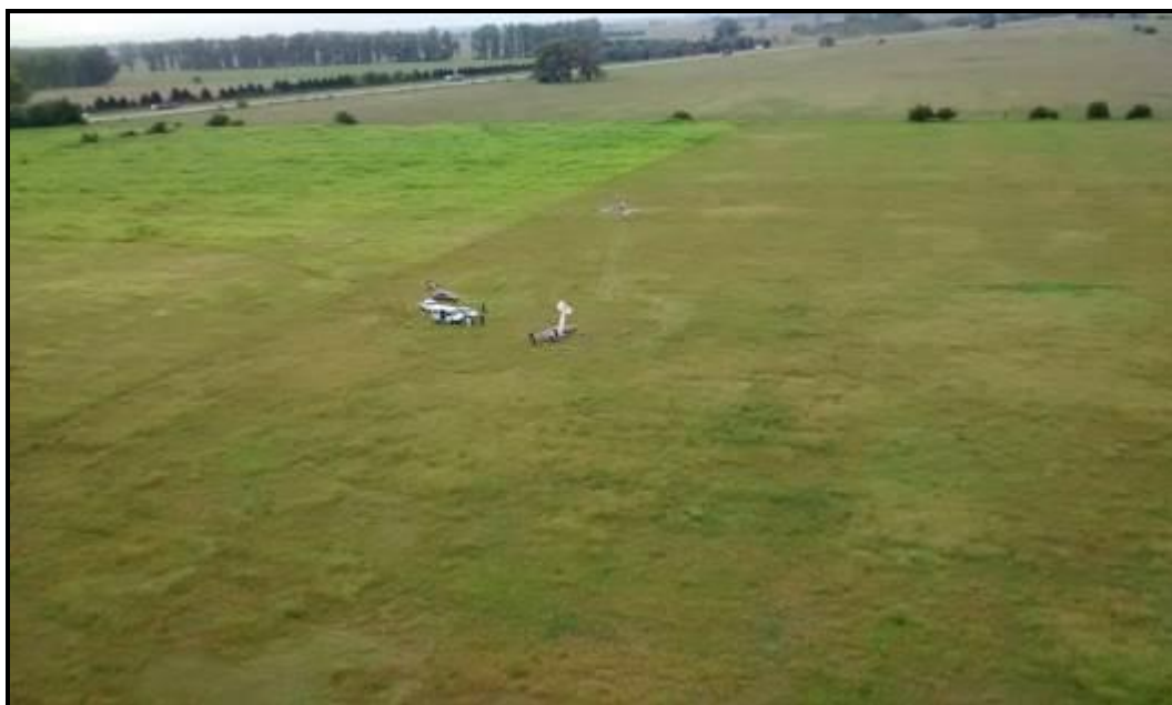
Fig. 2. Vista aérea del lugar del accidente, observando desde la vertical de la cabecera 34.

Las operaciones del Aeródromo Durana son estrictamente de acuerdo a las reglas de vuelo visual ( Visual Flight Rules , VFR) y deben ajustarse a lo establecido en la Sección 8, Anexo B del Manual de Aeródromos y Helipuertos (MADHEL) publicado por la ANAC, bajo Normas generales de operaciones en aeródromos ubicados debajo de Áreas de Control Terminal .