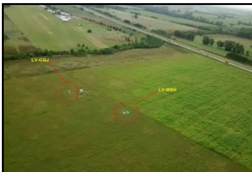
Fig. 1. Posición final de ambas aeronaves.

El accidente ocurrió de día y en buenas en condiciones meteorológicas.