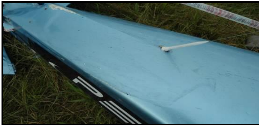
Fig. 6. Impacto sobre la parte superior del empenaje del LV-BSH.

La investigación estableció que los restos encontrados sobre el empenaje del LV-BSH corresponden al borde de ataque del ala izquierda del LV-CQJ, cerca de la punta de ala, y se encontraron en el estabilizador horizontal del LV-BSH.