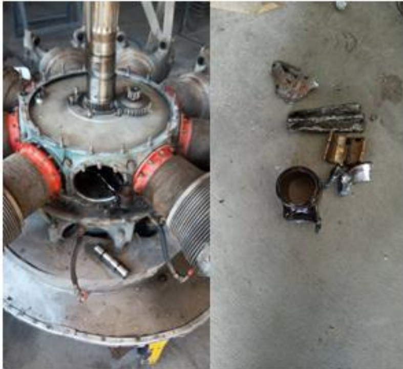
Figura 3. Vista general de motor y restos de bieletas

La bieleta número 6 presentaba una fractura en la zona de toma al cigüeñal. El colapso del mencionado componente produjo una serie continua de daños internos de forma colateral, que provocaron la detención del motor.