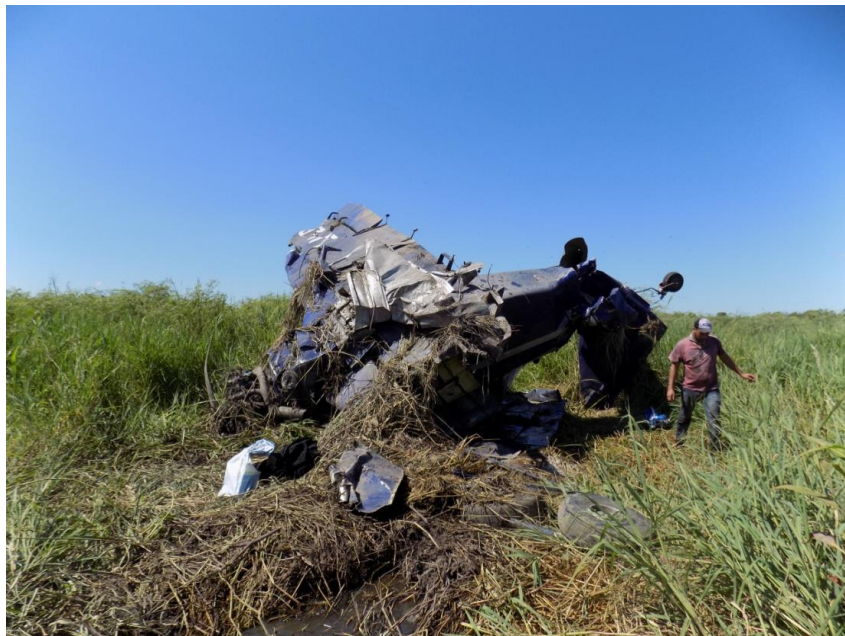
Figura 1. Posición final de la aeronave accidentada

El accidente ocurrió de día y en buenas condiciones meteorológicas.