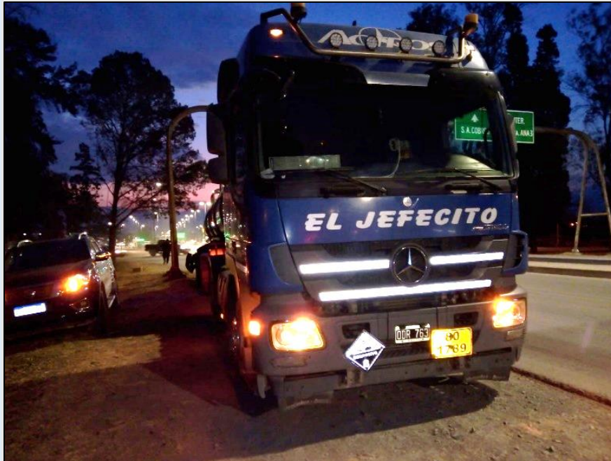
Figura 3. Fotografía con vista este-oeste de la posición y ubicación final del camión luego del accidente.