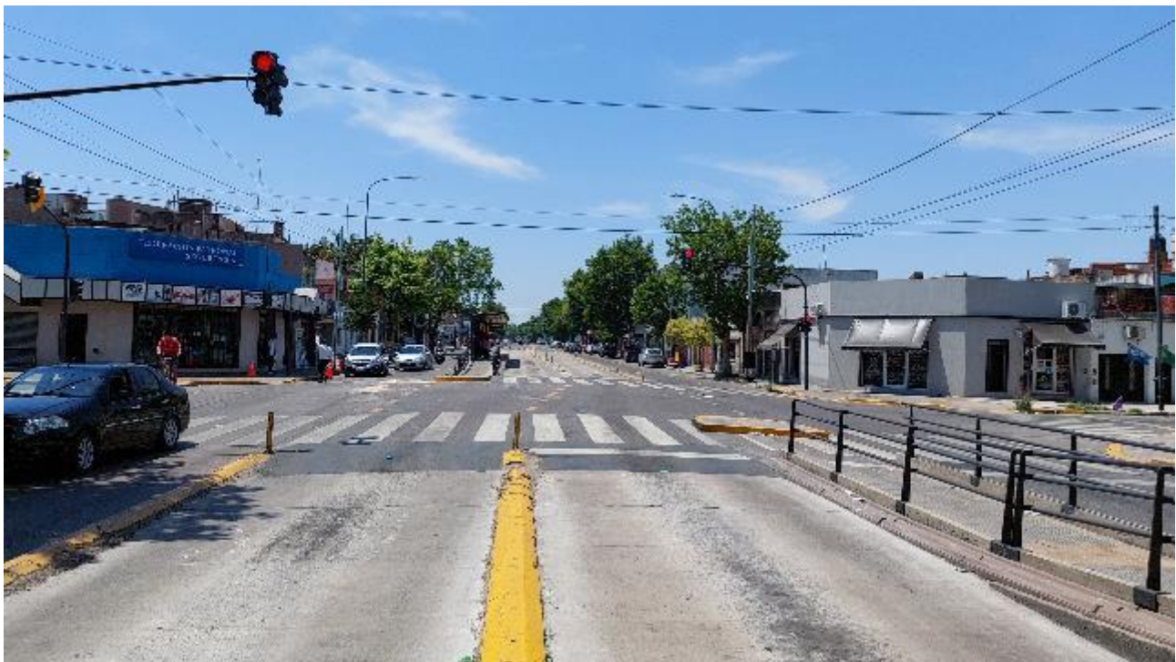
Figura 3. Fotografía del lugar del suceso, con sentido de circulación hacia la Avenida de la Fuente.

Se registra las siguientes señalizaciones horizontales: