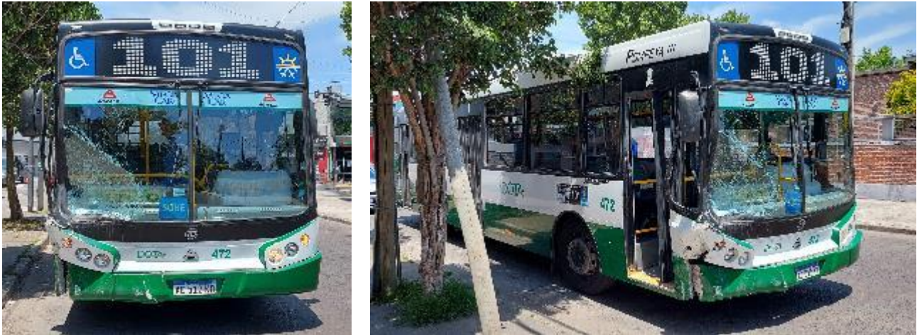
Figura 4. Daños generados en el Vehículo 1 en el contacto con el Vehículo 2.