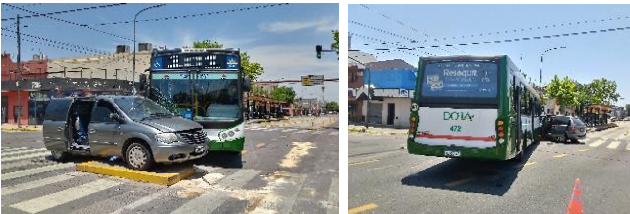
Figura 7. Posiciones finales del Vehículo 1 y Vehículo 2.

A partir de la descripción realizada previamente, y en relación con la secuencia fáctica, es posible establecer los siguientes aspectos del suceso: