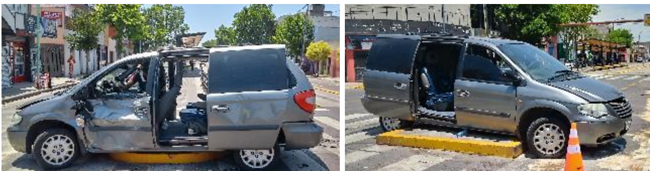
Figura 5. Daños originados en el Vehículo 2 por la colisión con el Vehículo 1.

El Vehículo 2 resultó dañado en su lateral izquierdo en el tercio central, dañándose principalmente la puerta del conductor.