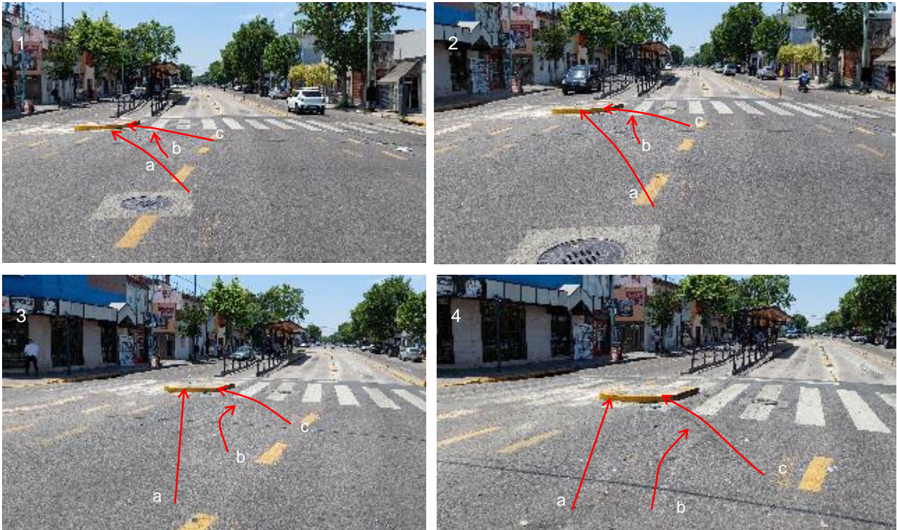
Figura 6. Huellas de frenado y arrastre de material suelto correspondiente al Vehículo 1 (a). Huella de arrastre de material suelto (b) y derrape (c) generadas por el Vehículo 2.