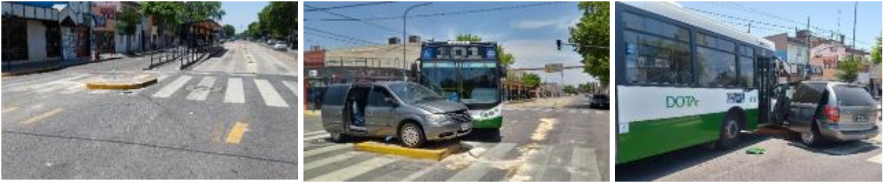
Figura 1. Posiciones finales de los vehículos, huellas y vestigios generados sobre la vía.