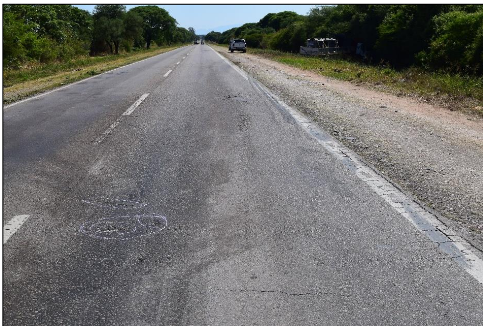
Figura 1. Fotografía de las huellas y rastros materiales dejados por la colisión y los vehículos protagonistas del accidente.