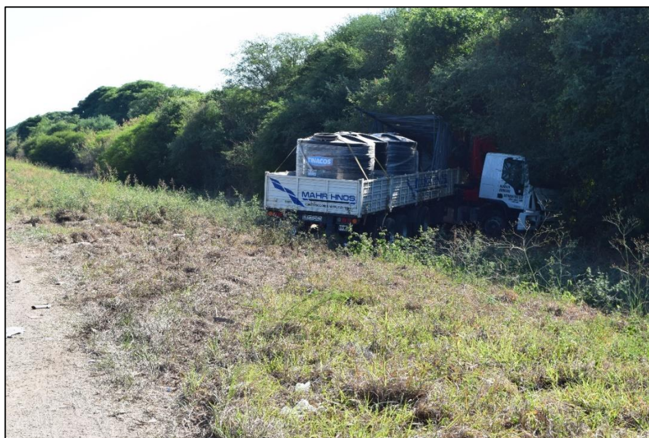
Figura 2. Fotografía con vista suroeste-noreste donde se observa sobre la zona de préstamo la ubicación y posición final del camión Iveco y su semirremolque.