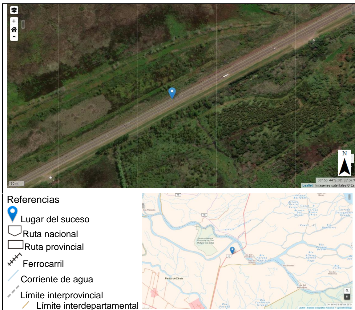
Figura 3. Localización del suceso en mapas.