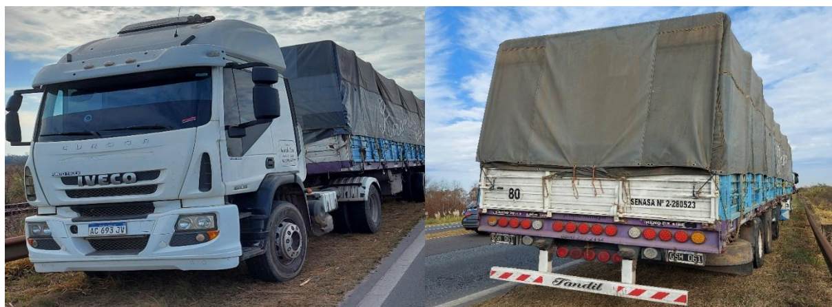
Figura 8. Fotografías del Vehículo 1.