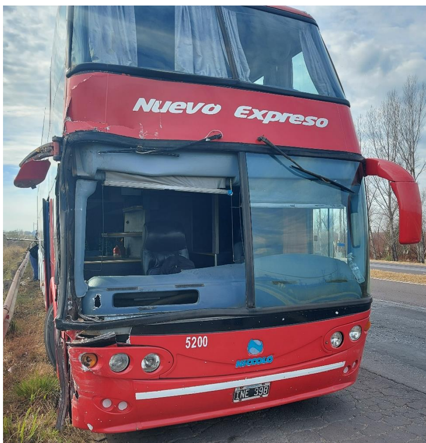
Figura 18. Fotografía del frente del Vehículo 6.