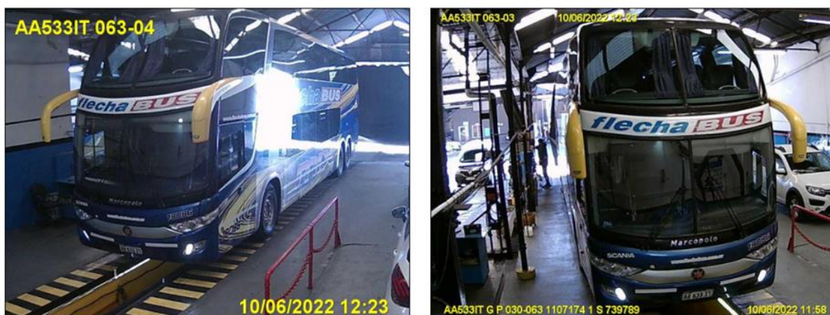
Figura 15. Fotovalidación del Vehículo 4 durante la Revisión Técnica Obligatoria.

El Vehículo 4 obtuvo daños en el sector anterior derecho y lateral derecho anterior. También en el sector frontal en toda su altura, incrementados sobre el lateral derecho, donde las deformaciones superan la línea del paragolpes. También se observaron faltantes de todos los parabrisas.