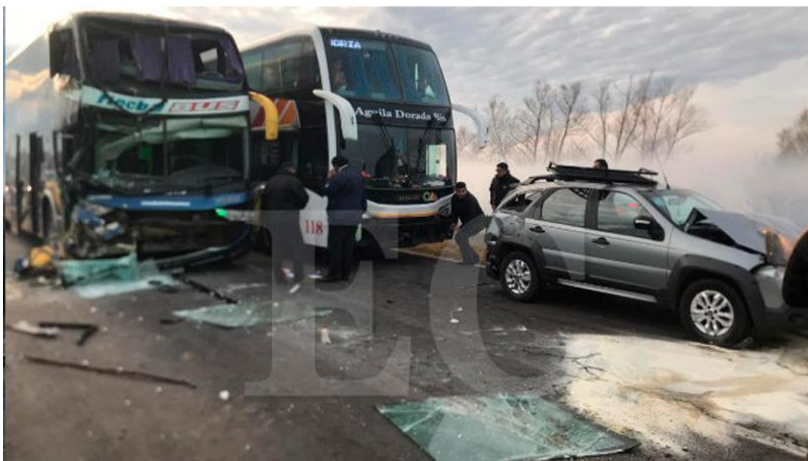
Figura 6. Posiciones de algunos de los vehículos involucrados momentos posteriores a la ocurrencia del suceso, en donde se puede percibir la neblina en el ambiente.

Al momento del suceso, las condiciones meteorológicas eran de cielo parcialmente nublado con neblina, con calzada seca y horario del amanecer, sin ángulo solar que propicie encandilamiento. Los vehículos se encontraban conduciendo con una visibilidad reducida producto de la neblina y de humo que había en la zona producto de quema en la zona.