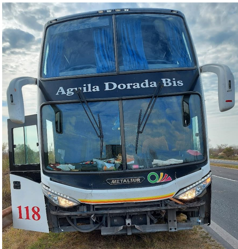
Figura 16. Fotografía del frente del Vehículo 5.