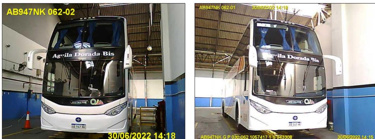
Figura 17. Fotovalidación del Vehículo 5 durante la Revisión Técnica Obligatoria.