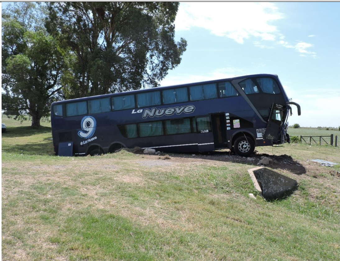
Figura 1. Vehículo 1 en su punto de inmovilidad final.