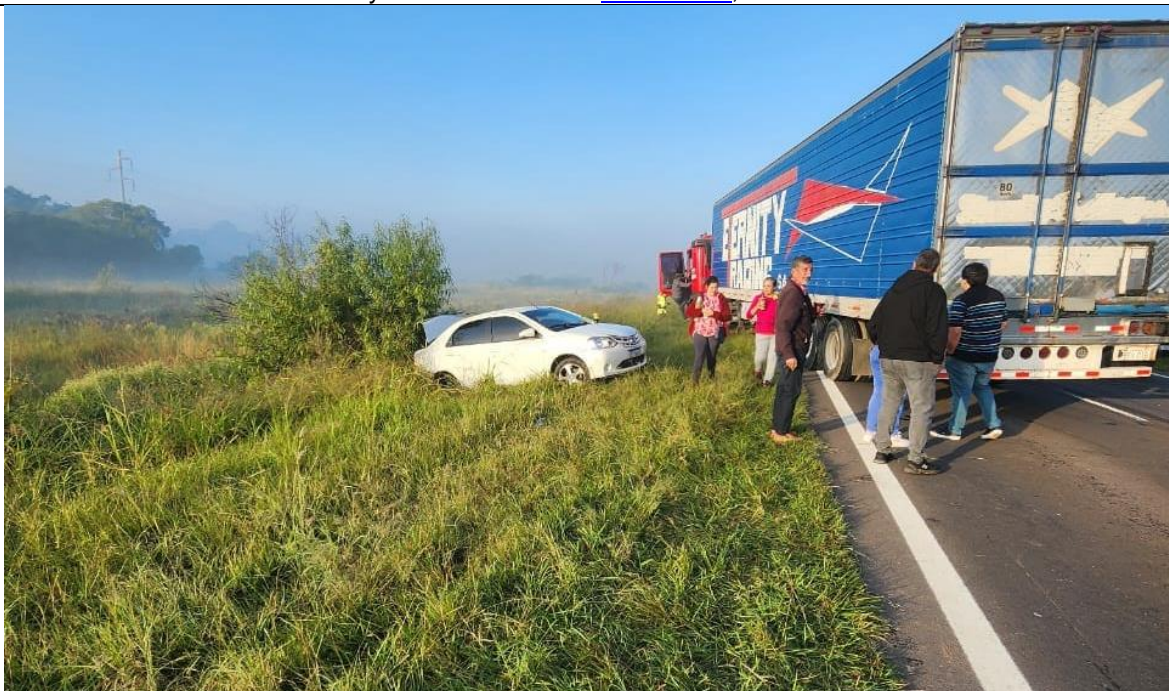
Figura 4. En la imagen se puede ver las posiciones finales del Vehículo 9 y el Vehículo 6. Fuente: Siemprecorrientes , 2023