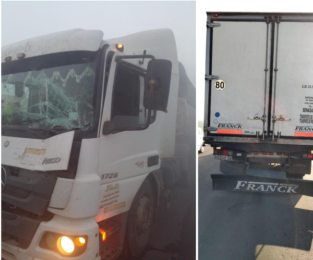
Figura 8. En las imágenes se pueden ver a los Vehículos 3 y 4 involucrados en una de las cadenas de colisión.