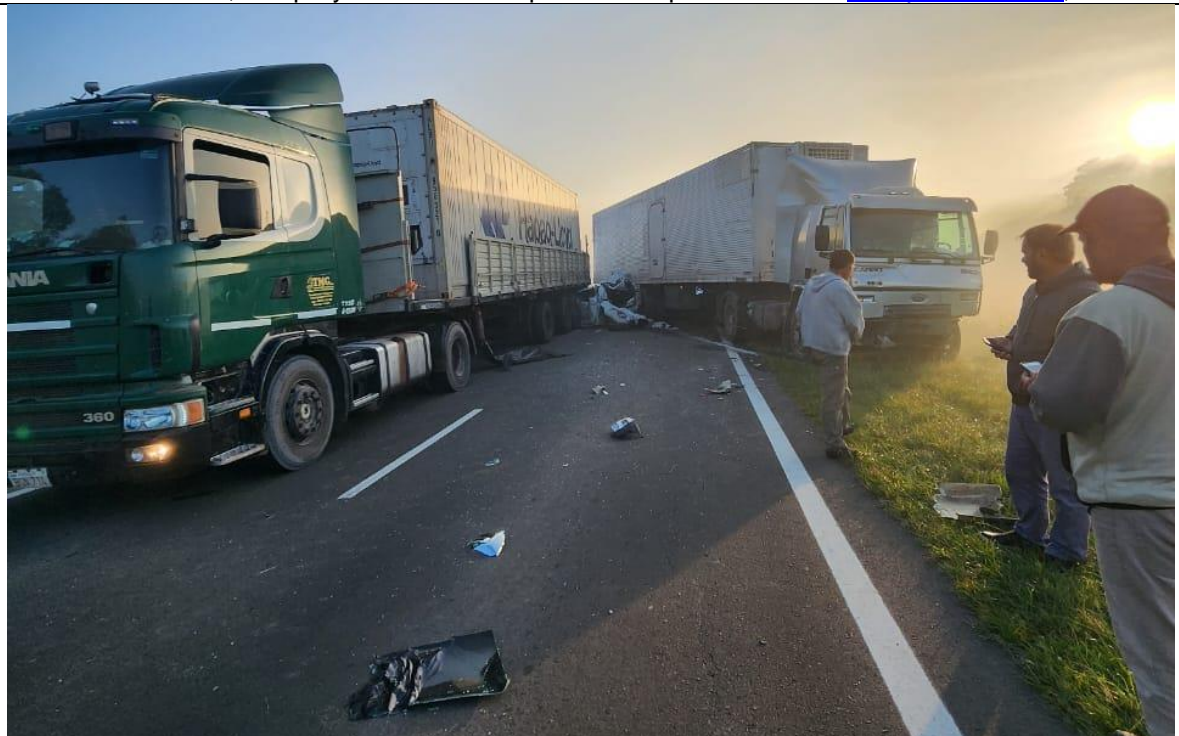
Figura 3. En la imagen se pueden ver las posiciones finales del Vehículo 5 sobre la ruta y del Vehículo 11 sobre la banquina. Entre ambos, completamente deformado, resulta visible el Vehículo 7. Fuente: Diarionorte , 2023