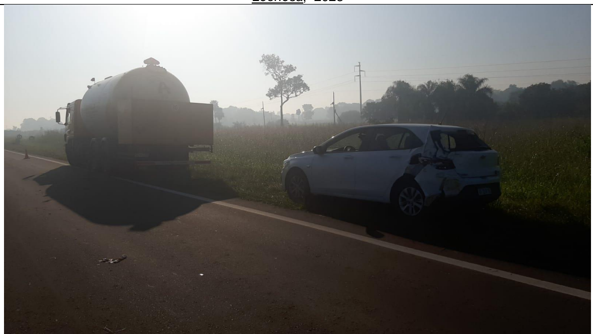
Figura 7. En la imagen se puede ver las posiciones finales de los Vehículos 1 y 2.