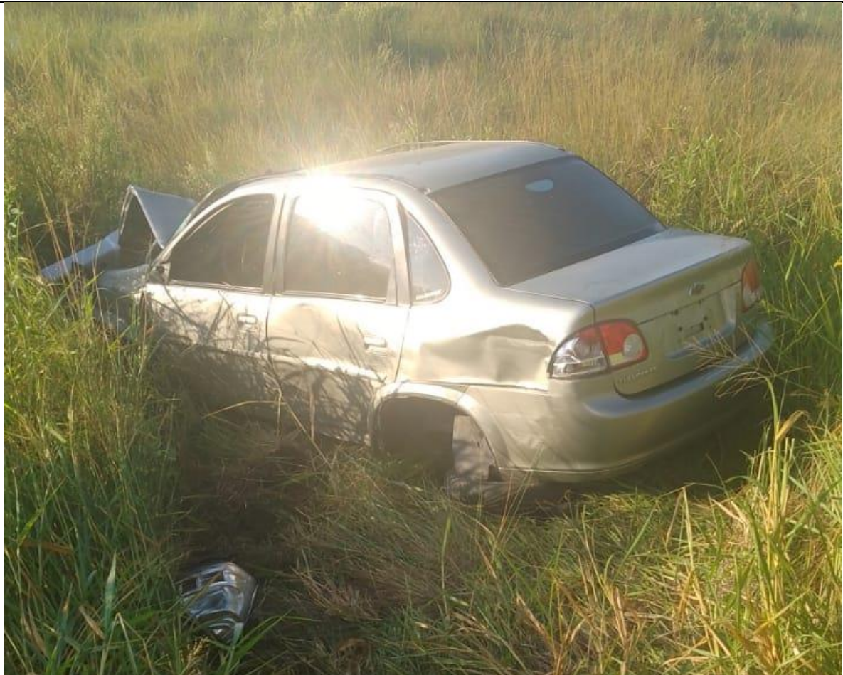
Figura 6. En la imagen se puede ver al Vehículo 8 afectado por la colisión.