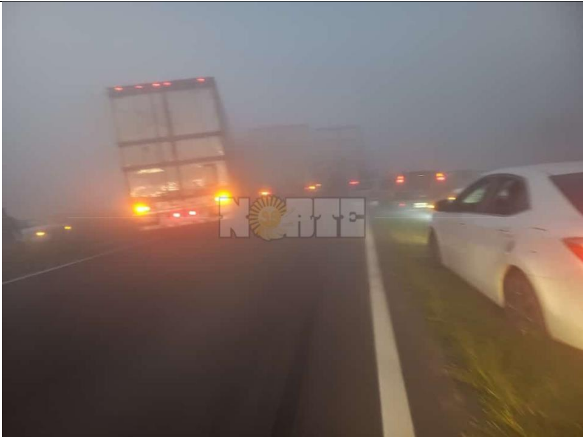
Figura 3. En la imagen se puede ver las posiciones finales del Vehículo 11, Vehículo 5 y Vehículo 6. Además resulta apreciable las condiciones de escasa visibilidad del entorno por causa del humo y la niebla.