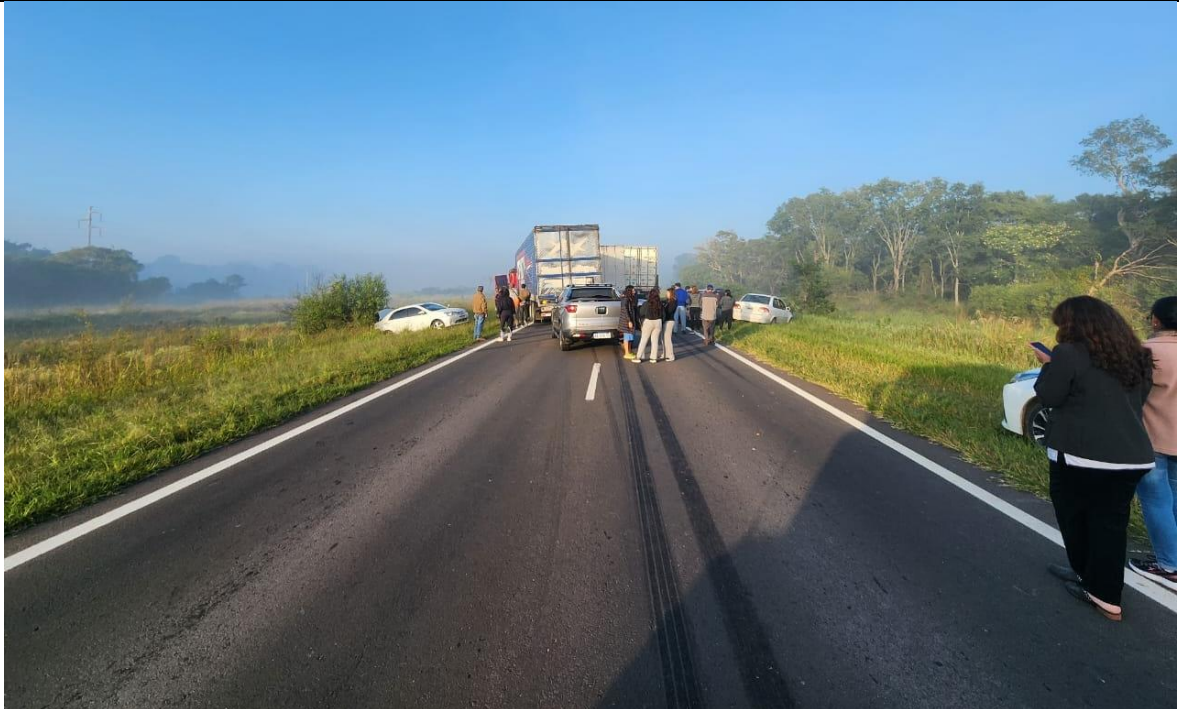
Figura 2. Vista del tramo de la ruta a la altura del kilómetro 1053, donde se produjo la colisión entre el mayor número de vehículos. En la imagen se puede ver la marca de frenada patentizada por uno de los vehículos, con proyección hacia el punto de impacto.