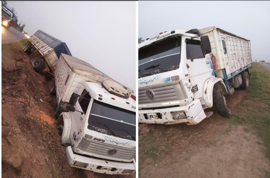
Figura 1. Posición final del Vehículo 1, antes de la remoción.