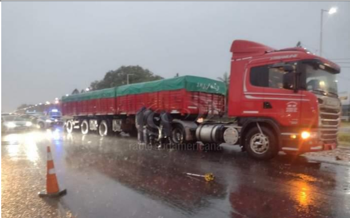
Figura 3. Vista de la posición final del Vehículo 1 y de las condiciones meteorológicas de lluvia intensa del entorno.