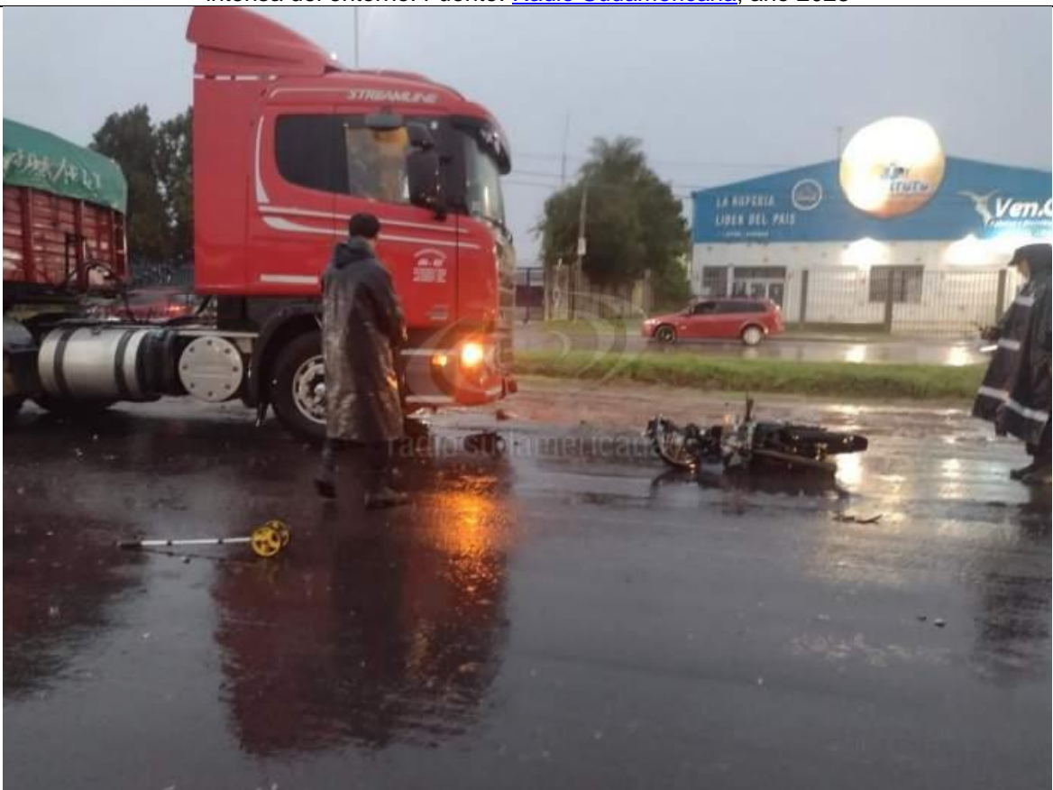
Figura 4. Vista de la posición final del Vehículo 2 con relación a la posición final del Vehículo 1.