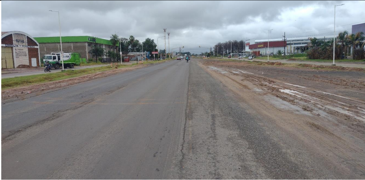
Figura 1. Vista panorámica del tramo de la ruta donde se desarrolló la colisión. La fotografía fue capturada según el sentido de circulación del Vehículo 1.