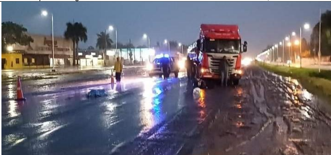
Figura 2. Vista de las posiciones finales del Vehículo 1, Vehículo 2 y su conductor. Además, en la imagen se aprecian las condiciones meteorológicas y de luminosidad del entorno.