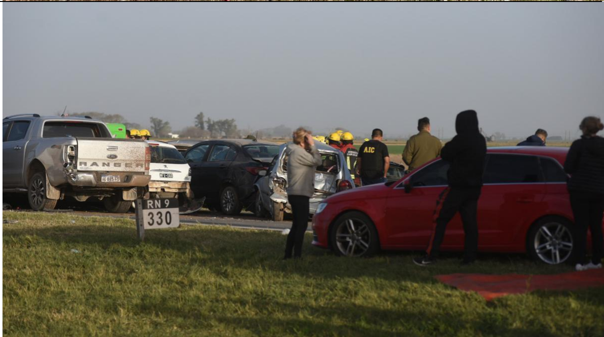
Figura 2. Algunos de los vehículos involucrados, en sus posiciones finales, luego de la colisión.