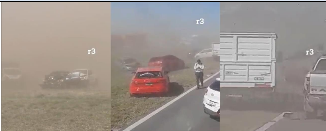
Figura 1. Vistas de la zona afectada por visibilidad reducida por tierra, momentos posteriores al accidente.