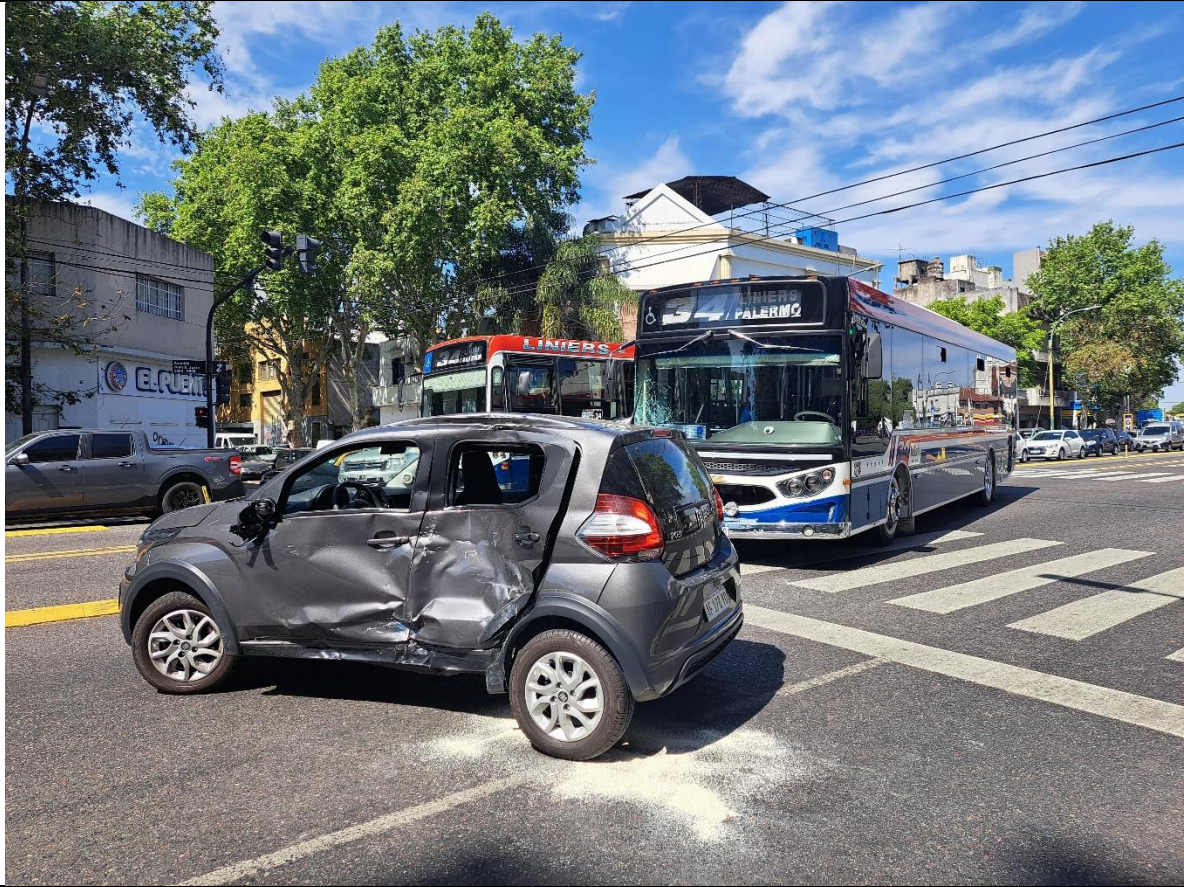
Figura 1. Posiciones finales de los vehículos.