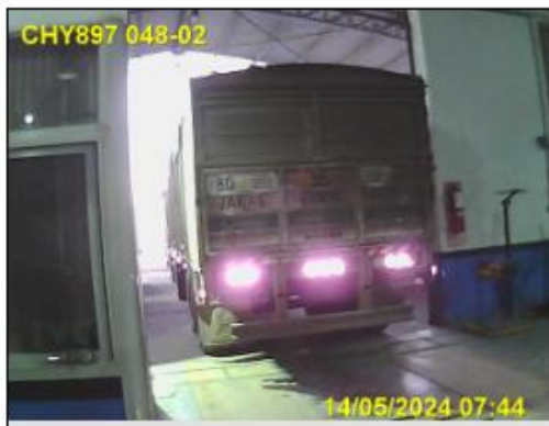
Figura 4. Fotovalidación última RTO del camión tractor.