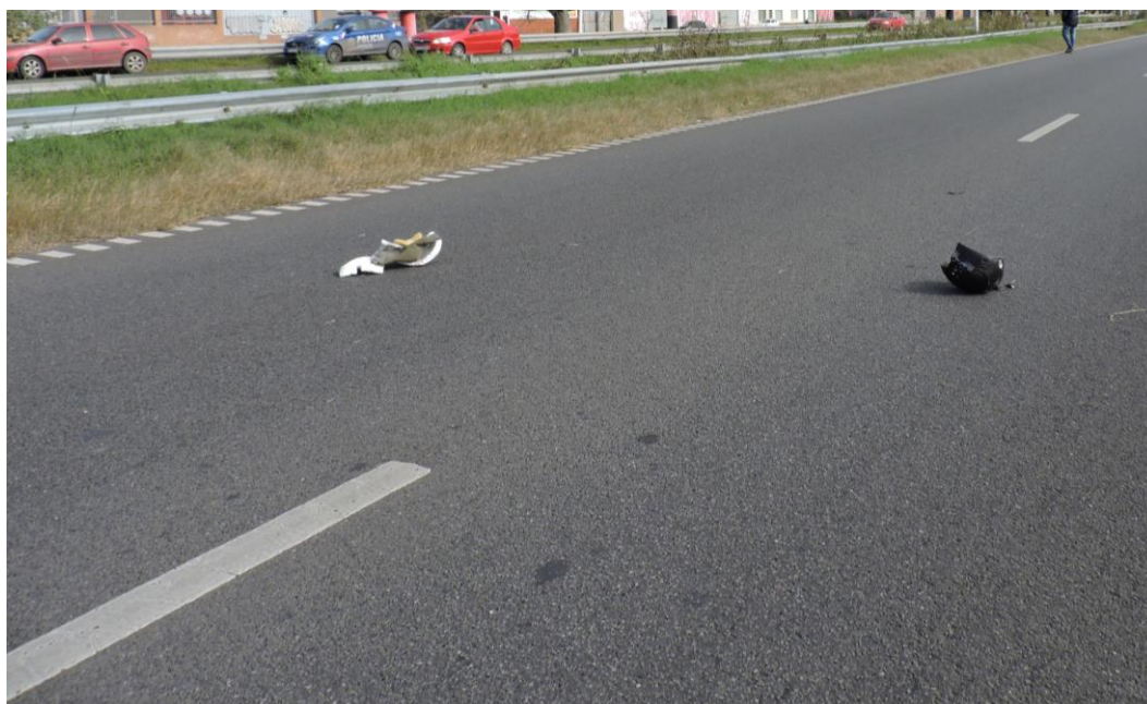
Figura 10. Partes del casco dispersas sobre la calzada.

A unos 7,90 m y 8,50 m por delante del final de las efracciones y a 2,20 m y a 5 m del borde de la calzada interna, respectivamente, se hallaron fragmentos de casco.