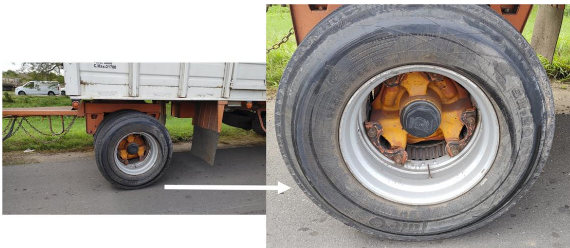
Figura 6. Daños en el neumático externo izquierdo del eje delantero del acoplado.

Durante la inspección del vehículo se visualizaron marcas blancas de fricción en el flanco del neumático externo izquierdo del eje delantero del acoplado. Además, se observaron marcas negras espiraladas, que indican que fueron realizadas con el vehículo en movimiento y las cuales se estiman recientes.