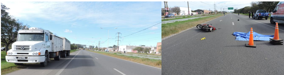
Figura 1. Posición final de los vehículos.