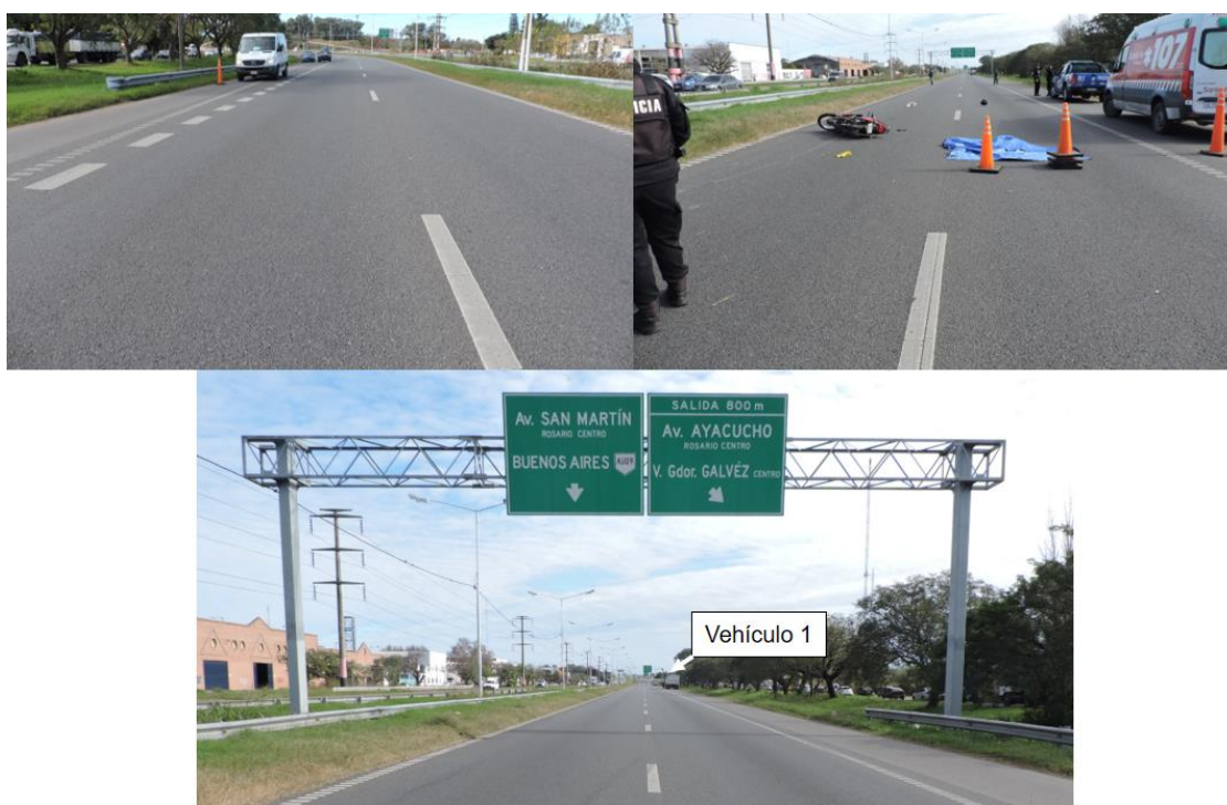
Figura 3. Arriba a la izquierda, vista del lugar con sentido opuesto al tránsito. A la derecha y abajo, vistas con sentido hacia la Avenida Ayacucho.

En lo que respecta a la señalización horizontal, se registraron línea blanca discontinua divisoria de carriles y línea blanca de borde de calzada en ambos laterales, la cual presenta diseño tipo perfilada, aunque sin relieve aparente. También se registraron, de forma previa al lugar del suceso, demarcaciones de flecha simple recta en ambos carriles y de flecha de reducción de carril en el auxiliar. Como señalización vertical se relevó, previo al lugar del suceso, paneles de prevención tipo chevrón en el tramo curvo, sobre el cantero central. De forma posterior al sitio del impacto, se registró un cartel informativo aéreo, unos 142,40 m antes de la posición final del camión con acoplado.