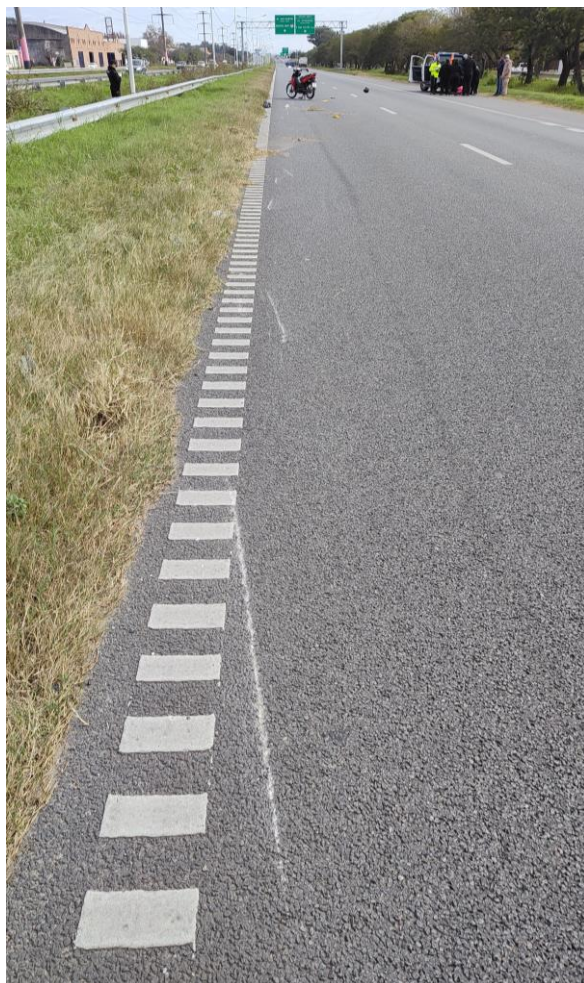
Figura 8. Marcas de efracción y marca negruzca sobre la calzada.

En su trayectoria posimpacto, el Vehículo 2 se deslizó sobre su lateral derecho y dejó sobre la calzada efracciones a lo largo de unos 32,70 m. Además, dejó una marca negruzca sobre la calzada.