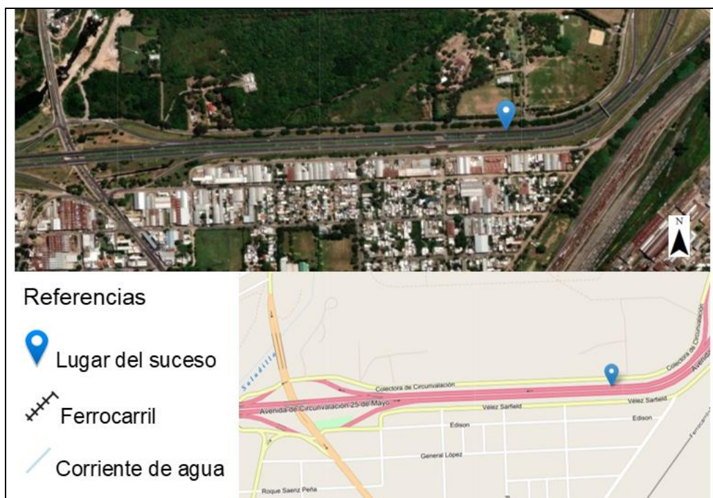
Figura 2. Mapa de localización del suceso.

El suceso se produjo en la Avenida de Circunvalación 25 de Mayo, en el departamento Rosario, provincia de Santa Fe, en las coordenadas geográficas -33.0152075, -60.6229924.