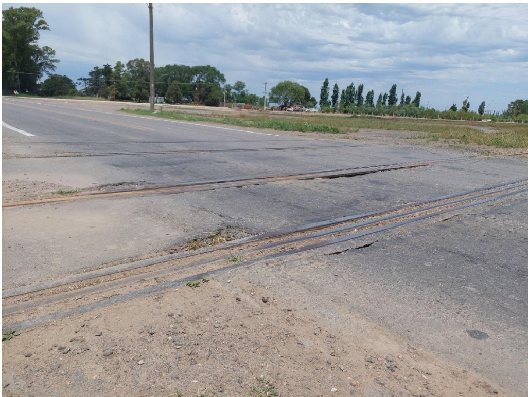
Figura 6. Condiciones de la cama de rieles (2° relevamiento). JST, 2022

Otra condición observada en el segundo relevamiento fue que los peatones utilizaban la vía férrea como camino, principalmente entre la RN 226 y el centro de la ciudad de Pehuajó. En dicha instancia también se constató que el estado de cama de rieles y de la calzada se había deteriorado en comparación a lo observado en el primer relevamiento, y que la vegetación de la zona de la vía del lado noreste de la RN 226 había incrementado (ver la Figura 8 en comparación con la Figura 6).