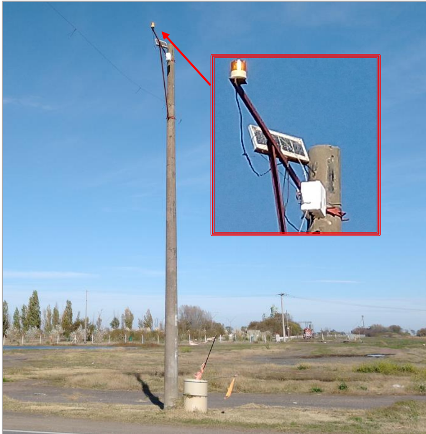
Figura 5. Baliza del poste ubicado en proximidades del PAN. JST, 2021

En el lugar se observó la presencia de un poste cercano al paso a nivel, en cuya parte superior se visualizaba una baliza, entre otros elementos.