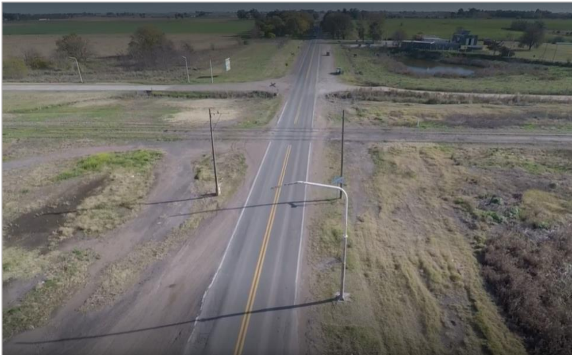
Figura 1. Vista sureste-noroeste del PAN de la RN 226.

El 16 de mayo de 2021, el tren de carga número 6643, conformado por la locomotora diésel eléctrica 6643 y 58 vagones vacíos, operado por la empresa FEPSA, partió a las 17:14 de Francisco Madero con destino a Pehuajó, provincia de Buenos Aires. A las 18:15 aproximadamente, al llegar al paso a nivel de la Ruta Nacional 226, se produjo la colisión del tren 6643 con un camión patente ODU 678, marca Iveco, que circulaba en sentido noroeste. El accidente ocasionó daños leves en el material rodante.