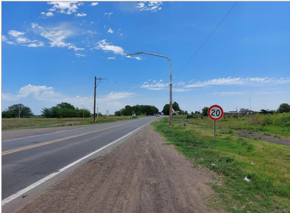
Figura 4. Vista del PAN desde la RN 226. JST, 2022