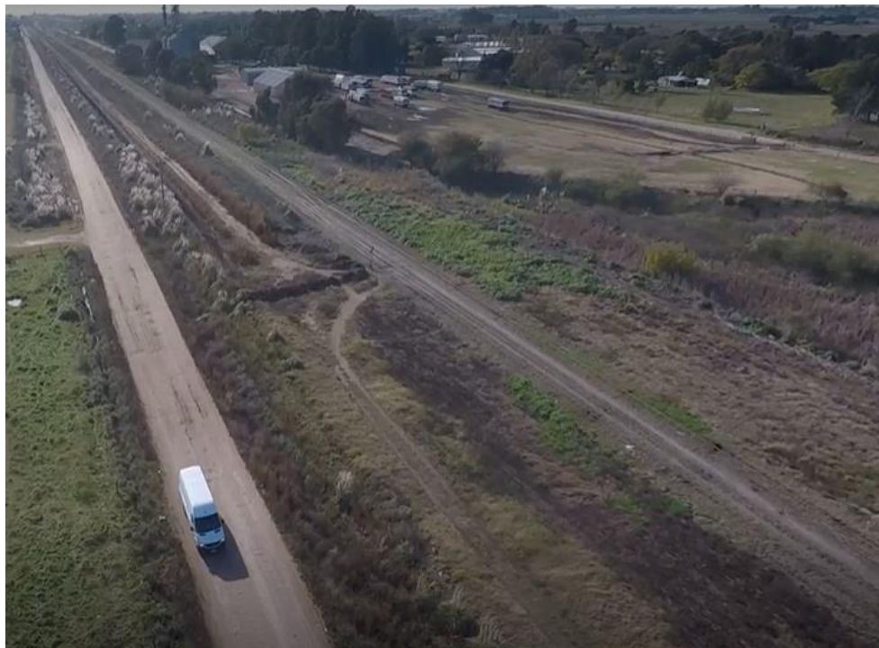
Figura 5. Zona del suceso, lado Pehuajó. JST, 2021