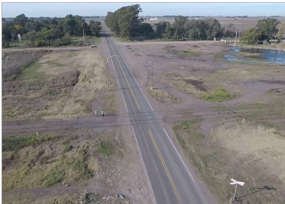
Figura 3. Vista noroeste-sureste del PAN de la RN 226.

Con respecto al entorno del suceso, como se puede apreciar en las figuras 3 y 4, el paso a nivel de la RN 226 no cuenta con las líneas de detención y cruces ferroviarios horizontales. Tampoco se observaron elementos reductores de velocidad en las proximidades del PAN.