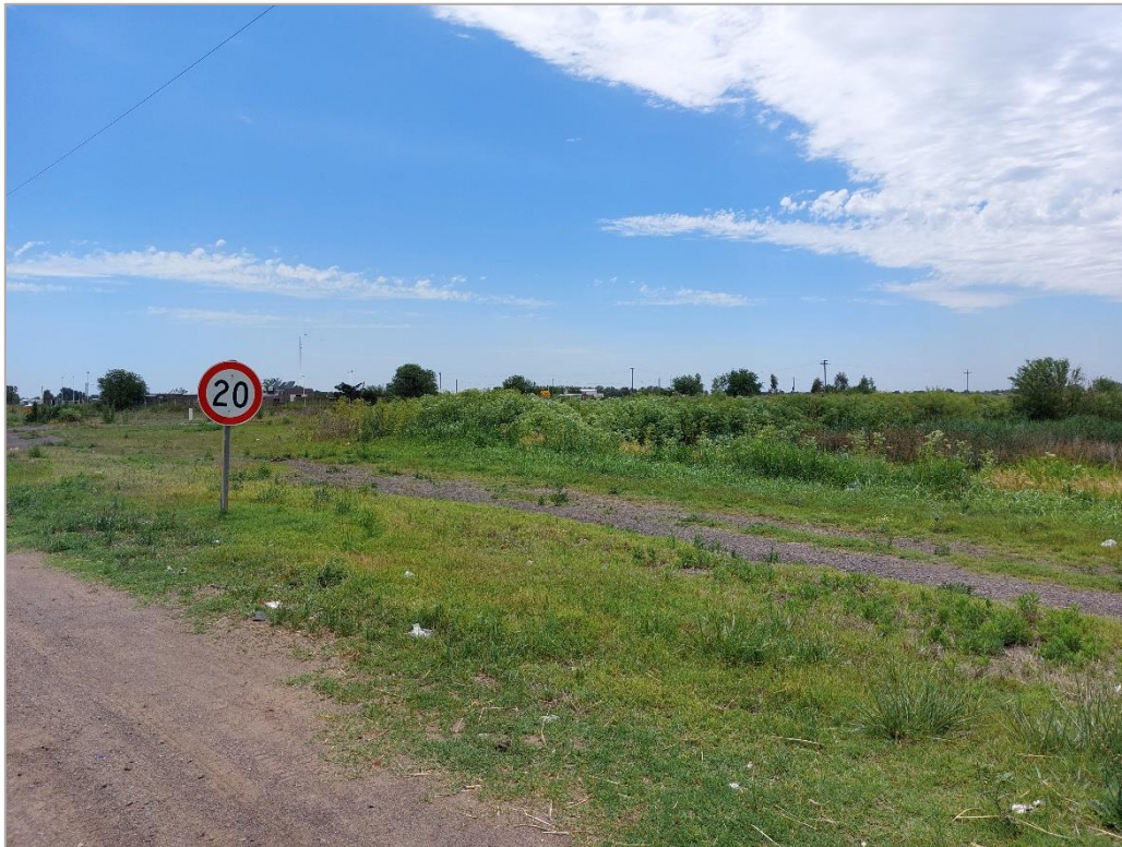
Figura 7. Vegetación en la zona del lado de Pehuajó (2° relevamiento). JST, 2022