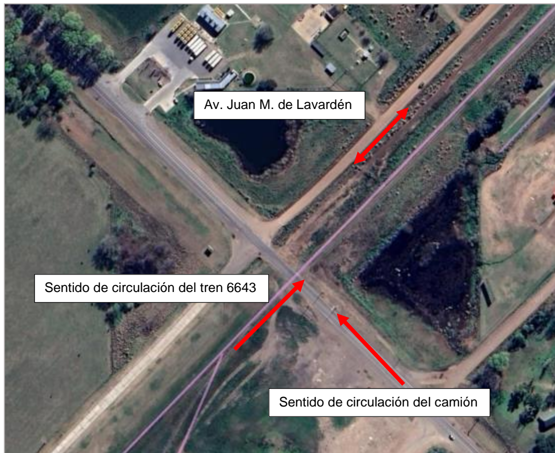
Figura 2. Vista satelital del lugar del suceso.

Durante el primer relevamiento, realizado en mayo de 2021, se registró la presencia de vegetación en los márgenes de la avenida. En una segunda visita de campo, llevada a cabo en noviembre de 2022, se constató el crecimiento generalizado de dicha vegetación.