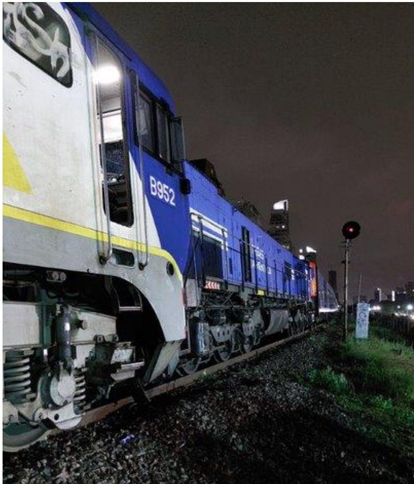
Figura 3. Locomotoras B952 descarrilada a la altura de la señal 55.

Cuando los investigadores de la JST arribaron al lugar del suceso se observaron ambas locomotoras colisionadas y dañadas sobre la vía descendente. La locomotora B952 se encontraba con el primer eje descarrilado.