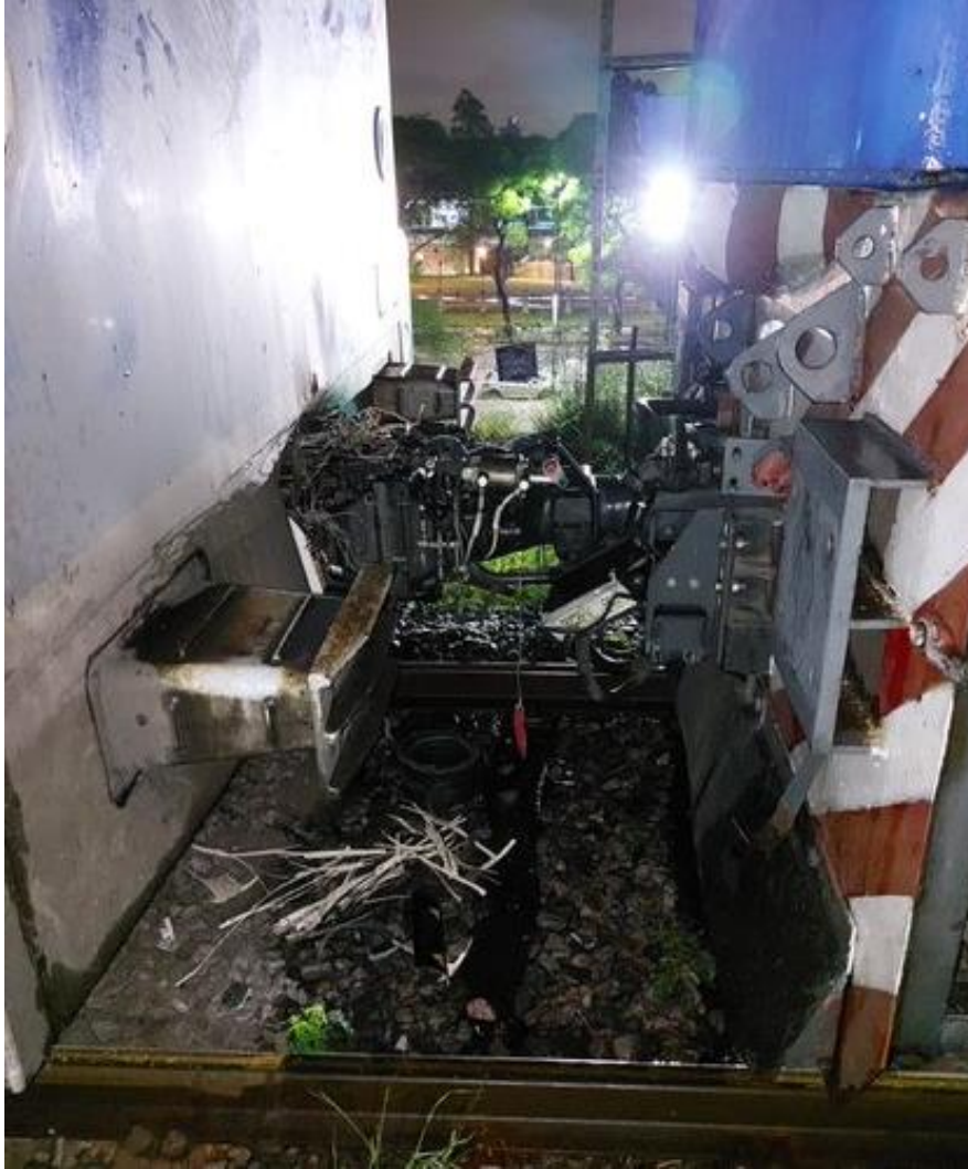
Figura 7. Daños en el enganche de la locomotora A901 y el primer coche de la formación.