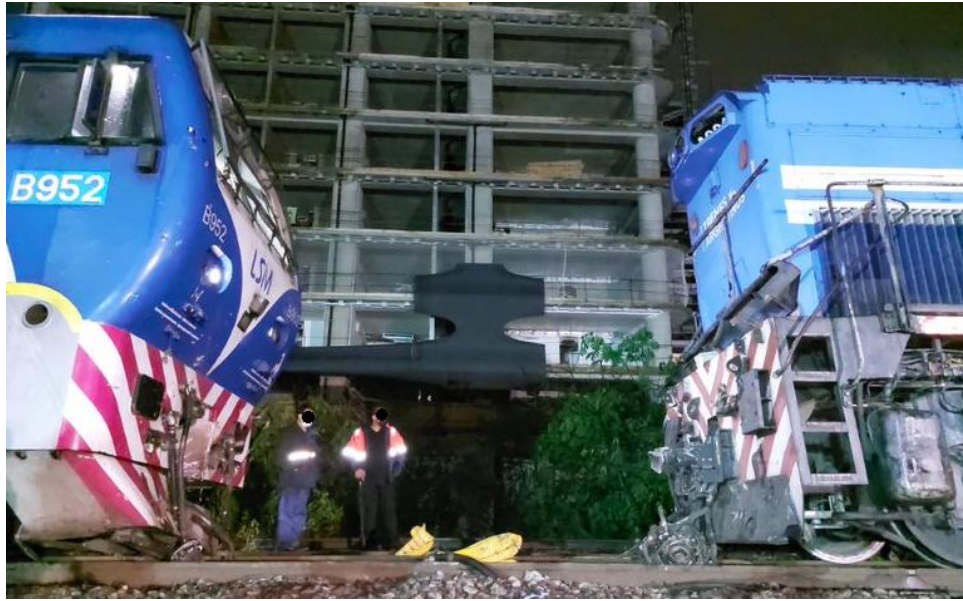
Figura 4. Daños en ambas locomotoras.