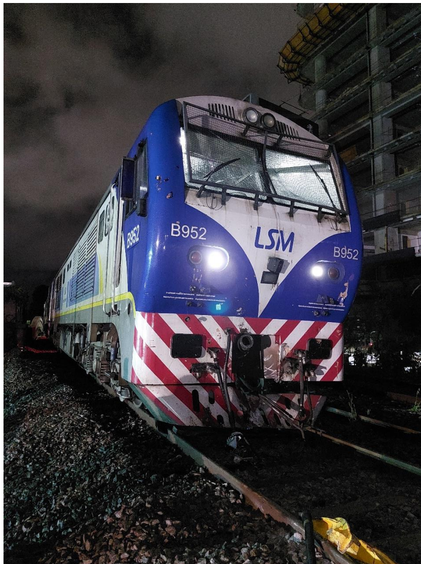
Figura 5. Daños en la locomotora B952.