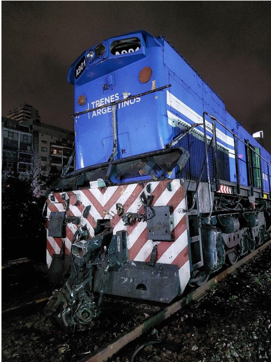
Figura 6. Daños en la locomotora A901.