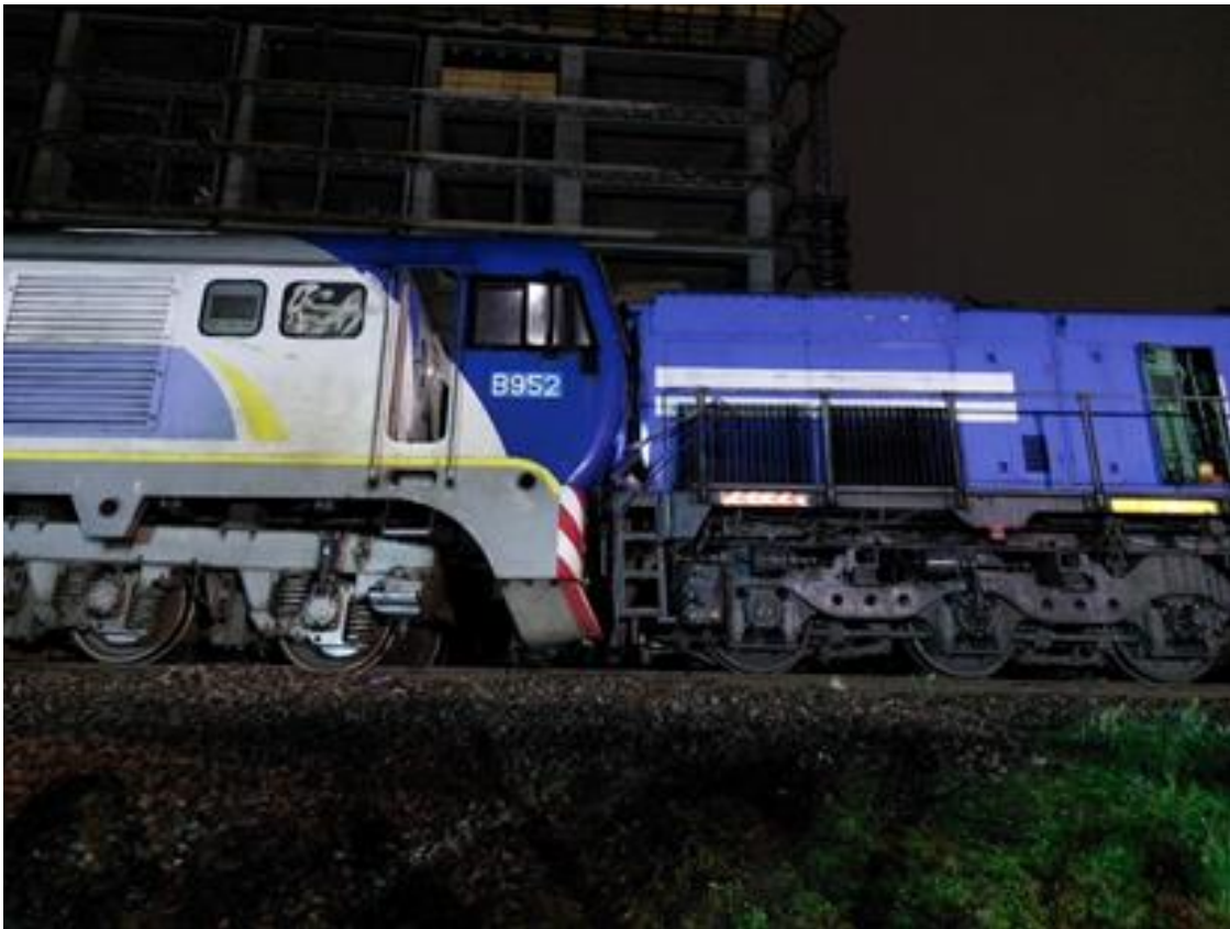
Figura 1. Locomotoras B952 y A901 impactadas en cercanías de la estación Palermo.

El 13 de noviembre de 2021, el tren 3894, conformado por la locomotora A901 y 7 coches con pasajeros a bordo, partió a las 21:34 de la estación Palermo con destino a la estación Retiro, ambas ubicadas en la Ciudad Autónoma de Buenos Aires. Luego de abandonar la plataforma de la estación, a las 21:36 aproximadamente, el tren se detuvo por desperfectos técnicos a la altura de la señal 55 (progresiva km 5,500). Alrededor de las 22:00, mientras el tren 3894 se encontraba detenido esperando auxilio, se produjo el choque de frente con el tren 3027, compuesto por la locomotora B952.