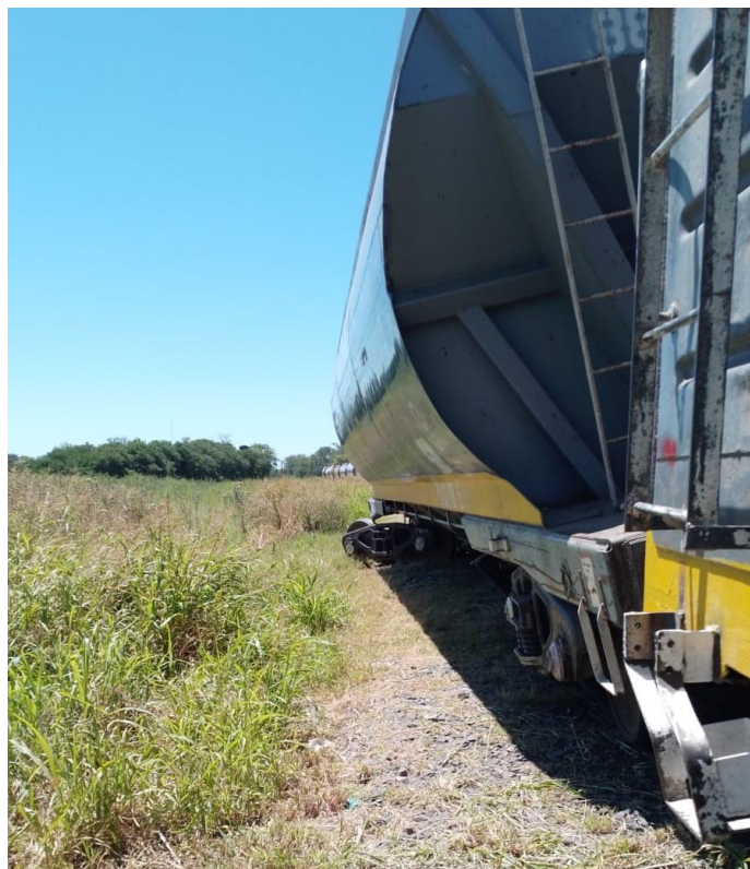
Figura 3. Vagones desplazados por el impacto.