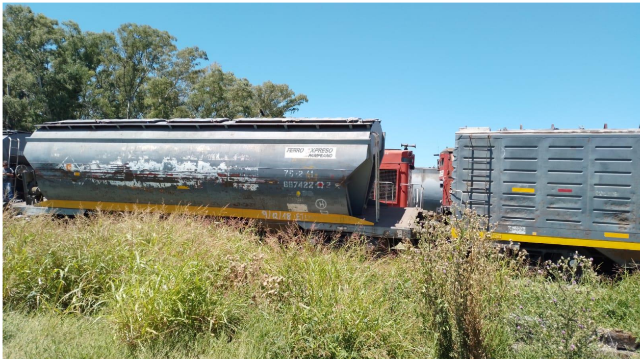
Figura 1. Vista general del suceso, sentido sur.

El suceso ocurrió a las 10:15 aproximadamente, cuando el tándem de locomotoras, que circulaba por la vía 5, tomó el aparato de vía n.º 14 para ingresar a la vía 6, e impactó con una formación que se encontraba detenida sobre esta última vía, obstaculizando la cruzada del cambio.