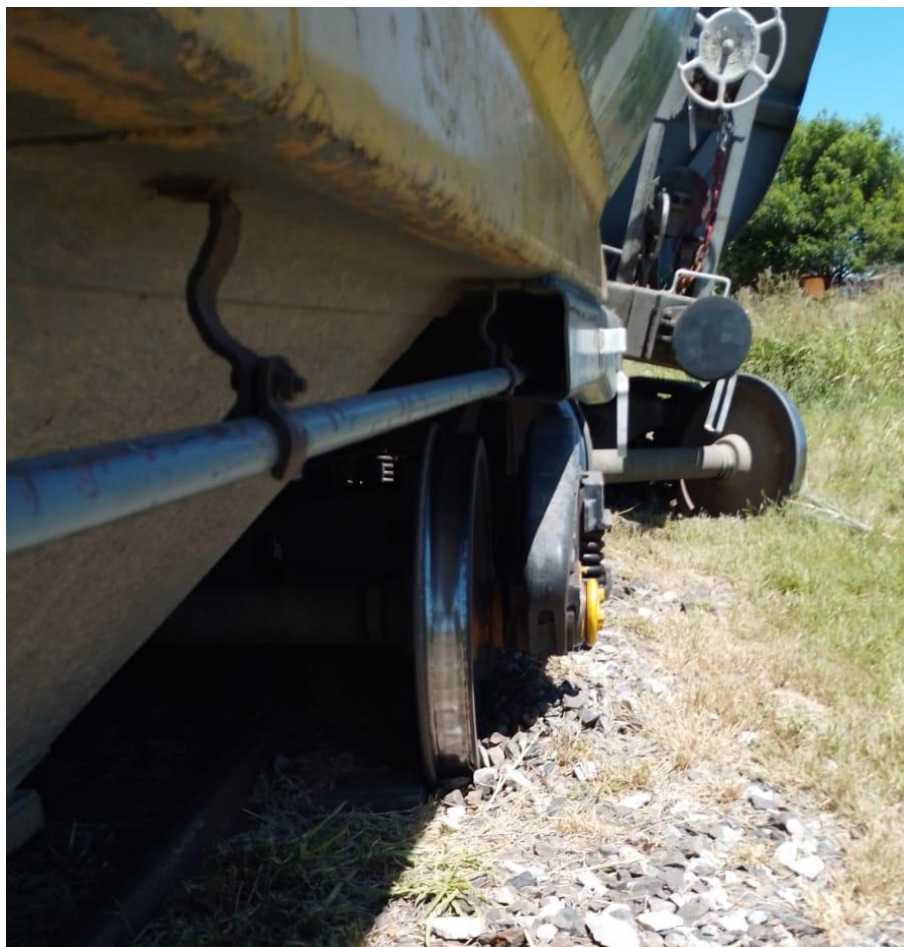
Figura 2. Vagones impactados por el tándem de locomotoras.