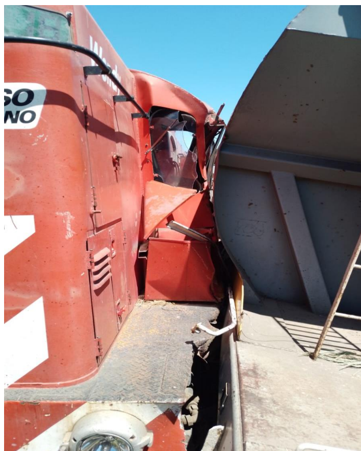
Figura 4. Daños en la cabina de conducción de la locomotora 6418.