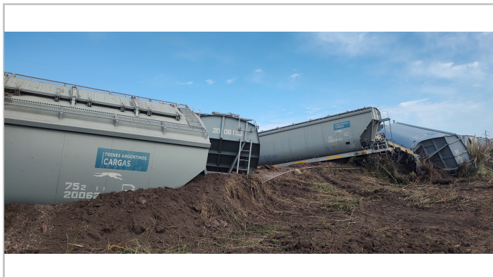
Fig. 2. Vagones descarrilados y volcados sobre la vía.