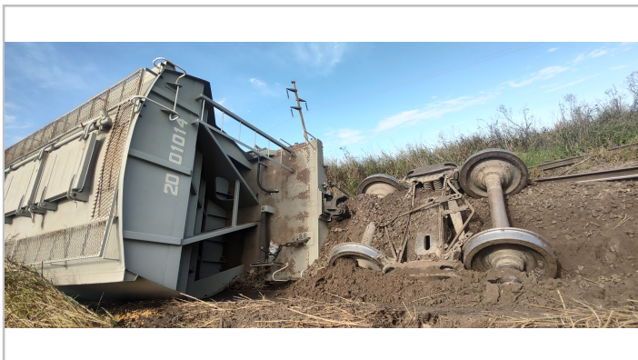
Fig. 3. Bogie desprendido del vagón 2001014, en posición n.º 28.