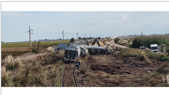
Fig. 1. Vista general del descarrilamiento, lado Sancti Spiritu.