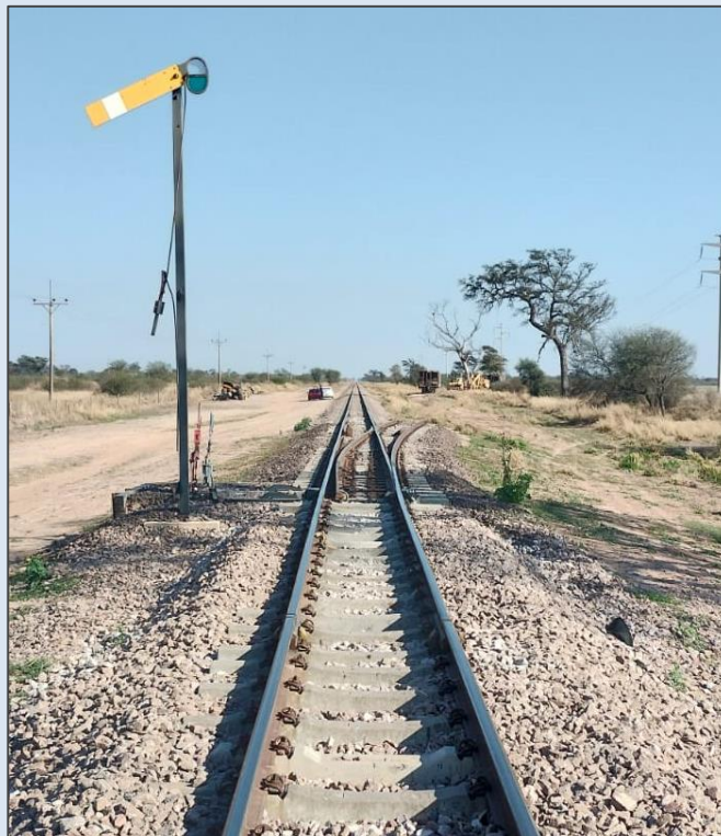
Figura 2. Imagen del desvío particular, donde se observa el indicador de posición del aparato de vía (ADV) de ingreso al mismo.