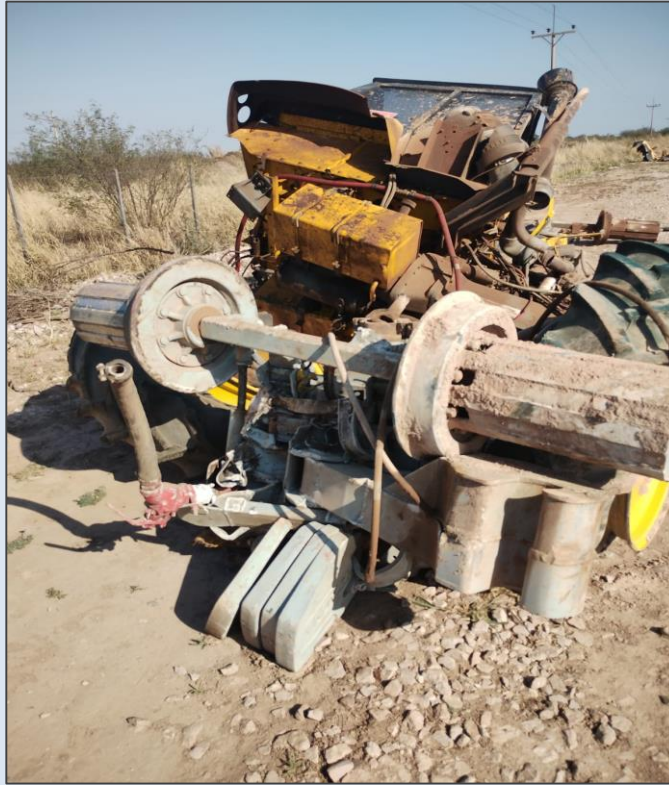
Figura 1. Restos de la maquinaria de vía afectada por el choque.