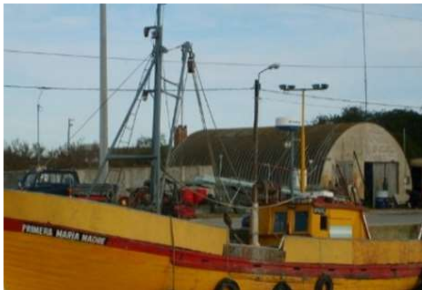
Figura 1. L/M Primera María Madre. Vista por su costado de babor.

Sus cuatro tripulantes fueron rescatados y llevados a puerto por el buque pesquero Lavalle II.