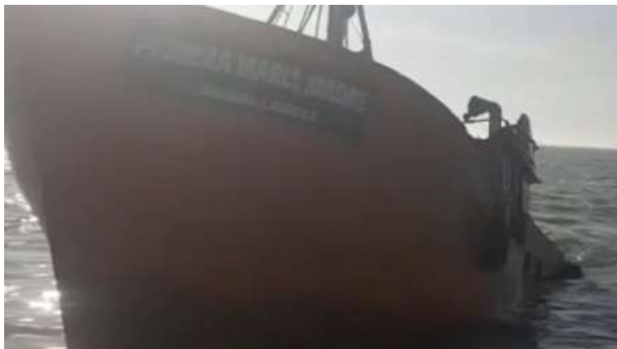
Figura 2. L/M Primera María Madre. Vista por su amura de babor durante el hundimiento.