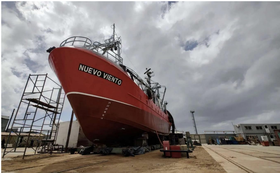
Figura 1: Buque pesquero Nuevo Viento visto desde su amura de babor.