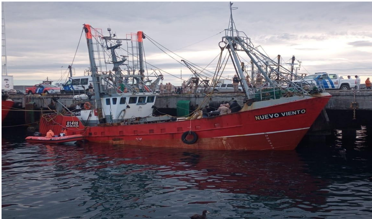
Figura 3: Buque pesquero Nuevo Viento. Vista por su banda de estribor.