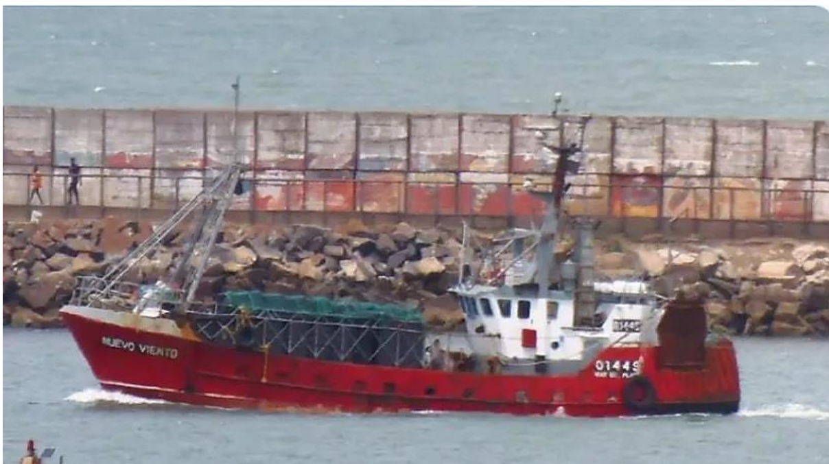
Figura 2: Buque pesquero Nuevo Viento. Vista banda babor.