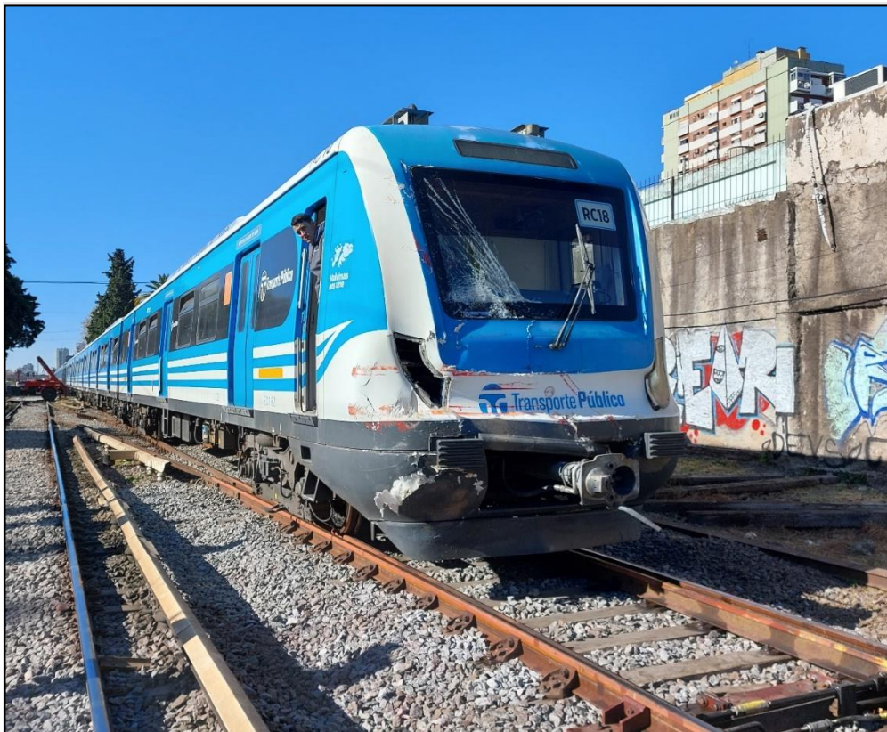
Figura 2. Fotografía del tren posterior al accidente

Se observaron daños de importancia en el sector frontal del coche cabina (en el acople, la óptica, el anticlimber , el pilar del lado izquierdo, el parabrisas y el miriñaque) y transferencia de pintura roja perteneciente a la caja portavolquete del camión. Los coches de pasajeros no presentaron daños.