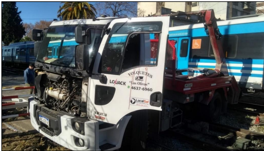
Figura 3. Fotografía del camión posterior a la colisión

Como consecuencia del impacto se produjeron daños directos en la unidad. Sobre el vehículo de cargas se observaron daños en el sector delantero, con predominio en capot. Además, se produjo desprendimiento del guardabarros delantero izquierdo y rotura del vidrio lateral izquierdo de cabina, así como de la cubierta trasera izquierda.