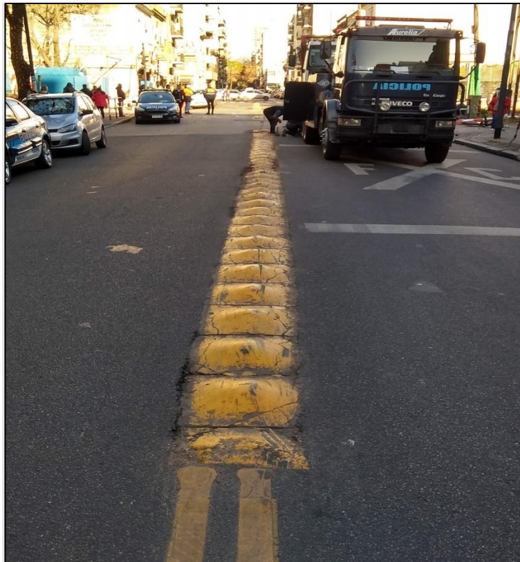
Figura 5. Imagen de la red vial