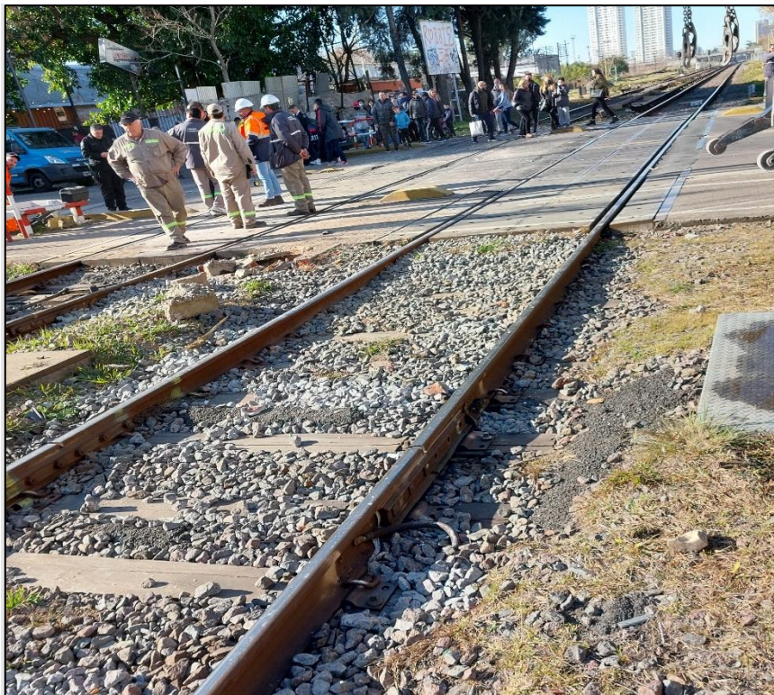
Figura 4. Imagen de la traza ferroviaria y PAN