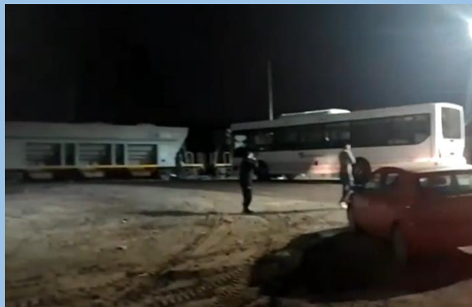
Figura 1. Posición final de los vehículos tras la colisión.