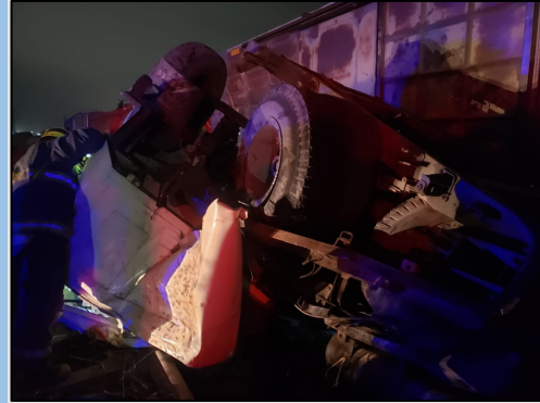
Figura 2. Posición final de la colisión.