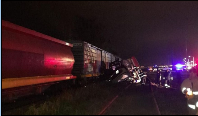
Figura 1. Posición final de la colisión